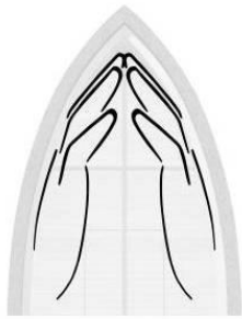
STICHTING MARIA'S KAPEL ENTER